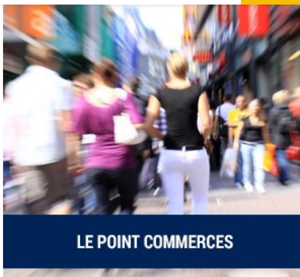
LE POINT COMMERCES