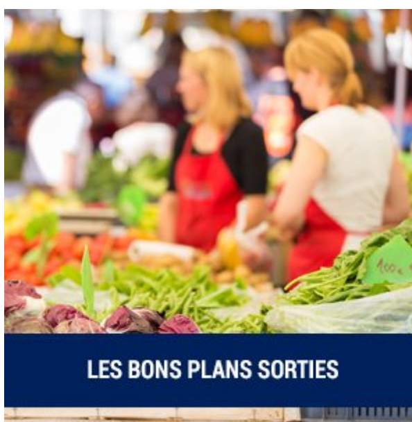
LES BONS PLANS SORTIES